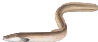
Europäischer Aal (Anguilla anguilla) Abbildung: DAFV, Eric Otten: